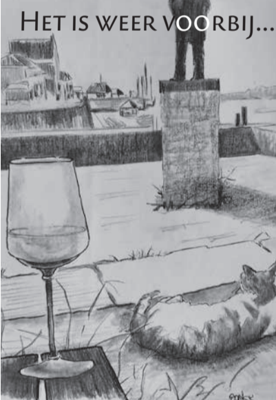
HET IS WEER VOORBIJ...