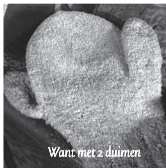
Want met 2 duimen

Heb je er wel eens aan gedacht wat er gebeurt als de huidige middenstand waaronder de horeca verdwijnt? Ik wel, en dat is geen leuk vooruitzicht. Er is nogal wat horeca verdwenen de laatste jaren. Laten we met z'n allen op de barricaden gaan en vanaf vandaag minimaal één keer per week een kop koffie, pilsje of wat dan ook bij onze horeca halen. We helpen ze de winter door, want we zijn van elkaar afhankelijk om een levendig stadje te blijven!