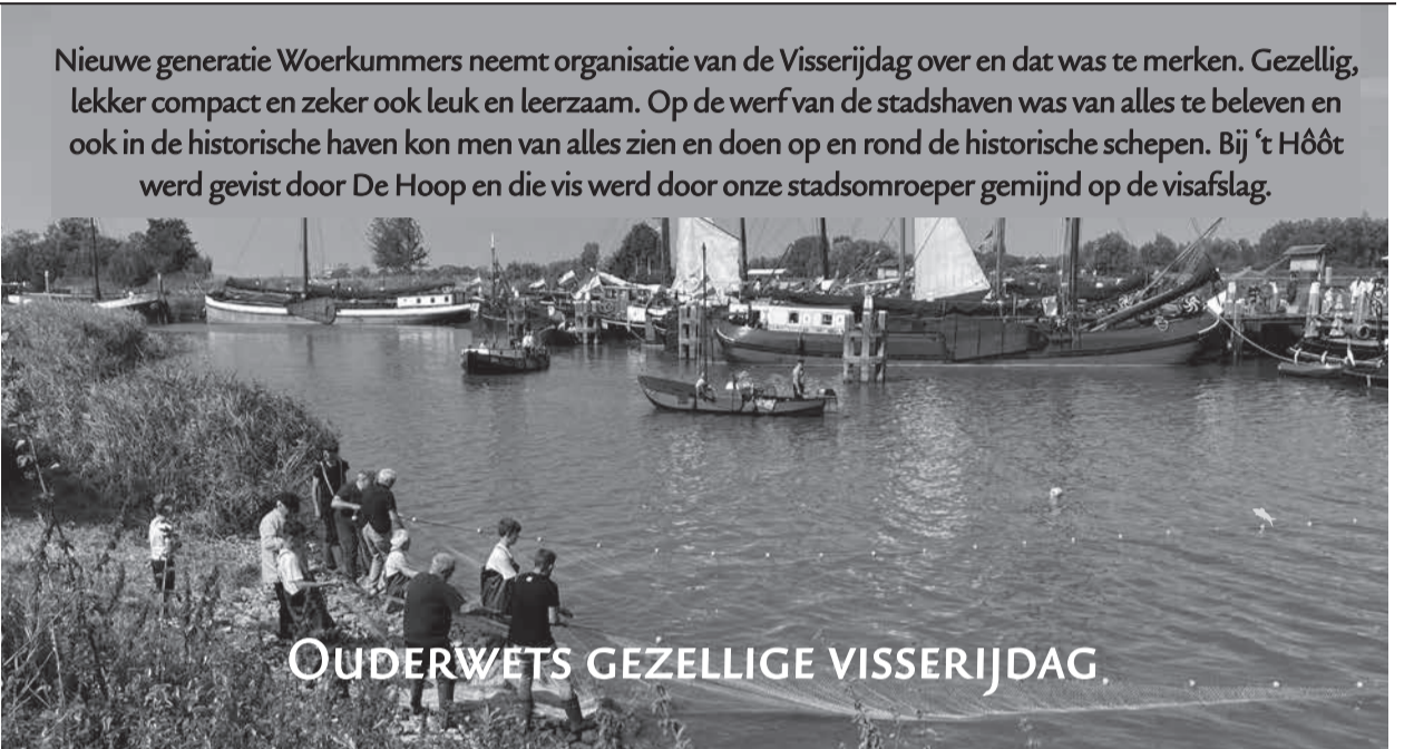
Nieuwe generatie Woerkummers neemt organisatie van de Visserijdag over en dat was te merken. Gezellig, lekker compact en zeker ook leuk en leerzaam. Op de werf van de stadshaven was van alles te beleven en ook in de historische haven kon men van alles zien en doen op en rond de historische schepen. Bij 't Hôôt werd gevist door De Hoop en die vis werd door onze stadsomroeper gemijnd op de visafslag.