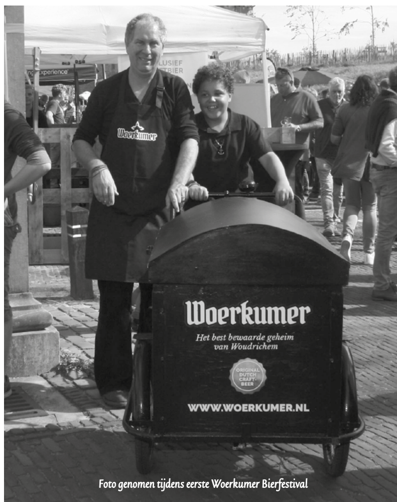
Foto genomen tijdens eerste Woerkumer Bierfestival