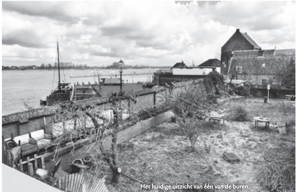
Het huidige uitzicht van één van de burens.

PARKEREN Andere buurtbewoners maken zich zorgen over toenemende parkeerdruk en/of overlast van horeca. Die zorgen zijn vooral