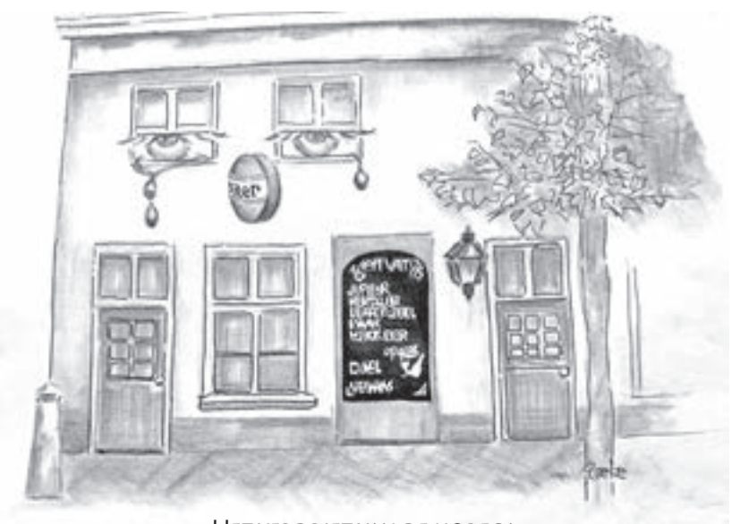
HET VERDIET VAN DE HORECA